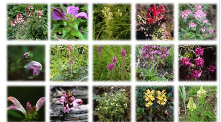
Figure 2. Pedicularis in Japan.