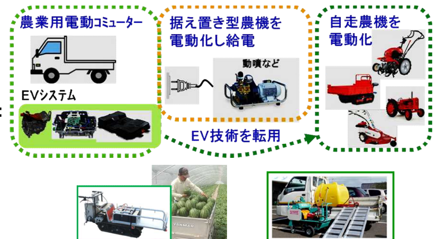
Figure 2 Overview of Electric driven agriculture