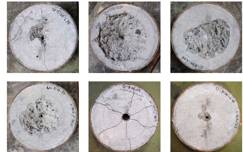
Figure 1. Crack pattern of post installed adhesive anchor.

The experimental and analytical results revealed that the constitutive laws of interface elements between the substrate concrete and the adhesive (UHPFRC) significantly affect the peak load and the deformation of post-installed adhesive anchor under the pull-out force.