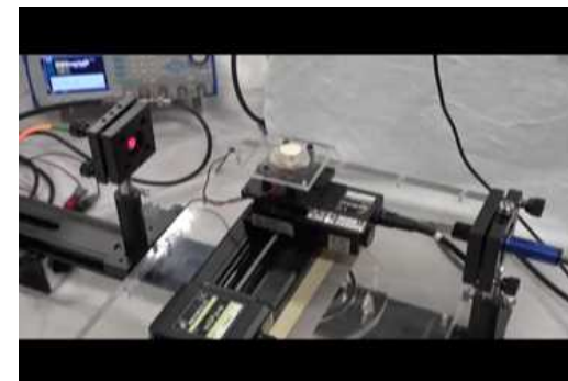
Figure 2 Sound distribution measurement