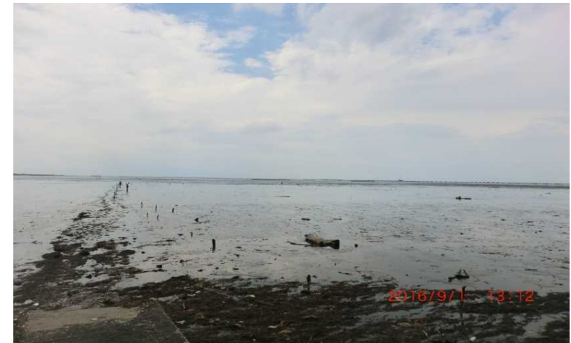
Figure 1 Shirakawa Delta

Sand particles have many characteristics like sand grain size, roundness, standard deviation, skewness, color, mineral compositions and chemical elements. They are closely related to sediment transport or beach profile changes.