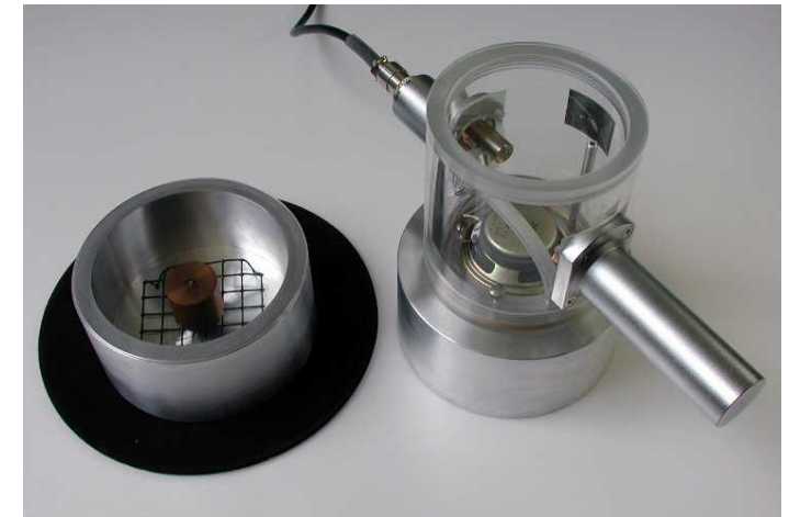
Figure 1 Acoustic volume meter.

Temperature error compensation in leak test utilizing correlation technique, Leak test based on Lagrange interpolation formula, Acoustic leak tester, Non-destructive and non-contacting test using acoustic intensity, Non-destructive thin film test using sound.