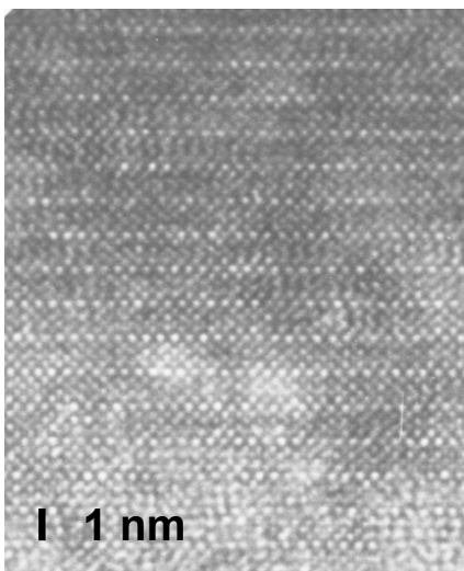
Layered oxide catalysts

Nano-structured catalyst for energy production: Bulk-type redox type catalysts for hydrogen production from water vapor, metal oxides and sulfides having controlled band structure for efficient photocatalytic water splitting for hydrogen evolution under visible light irradiation.