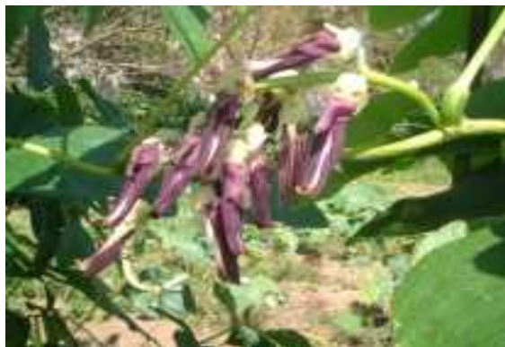
Figure 1 Mucuna hassjoo

また同時に、未だ植物界ではその存在が確定していないチロシンヒドロキシラーゼが高活性で見られたため、めしべを材料に同酵素の単離・精製を行う予定である。