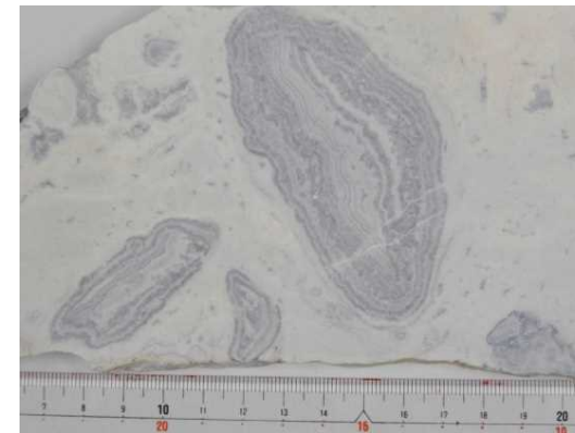
Figure 1 Orbicular marble from the Hirao Limestone

Modeling of periodic precipitation in the mineral-fluid system : We have made a model explaining such kind of periodic precipitation of minerals in the mineral-fluid system (Fig.2). Parameters controlling the precipitation of minerals were selected. Regions of precipitation and dissolution were defined using nullclines. In the phase space, periodic precipitation was explained by interaction of reaction and diffusion.