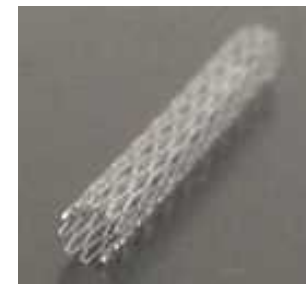
Figure 3 Coronary stent