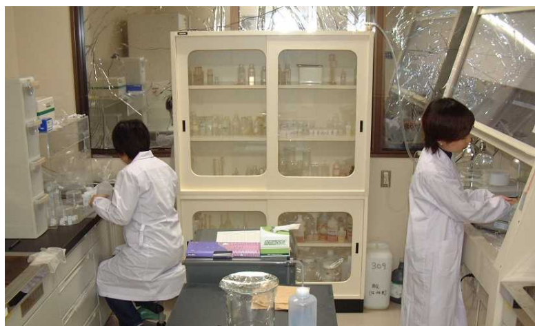
Figure 2 Sr separation from carbonates in TIMS column lab.