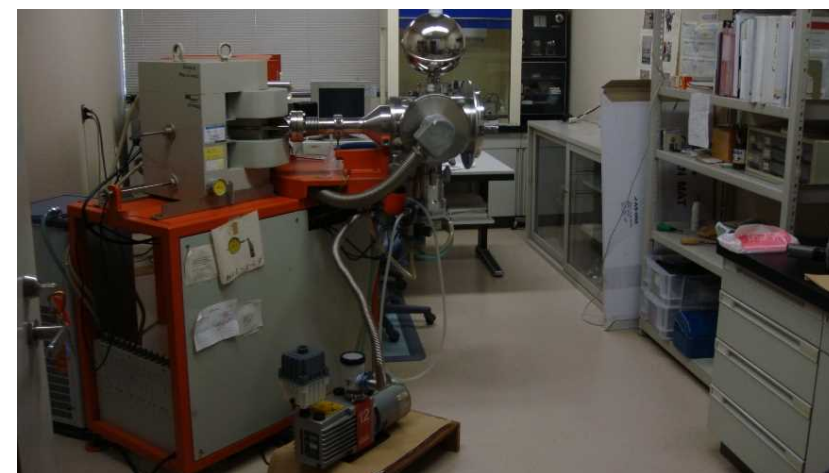
Figure 3 Thermal ionization mass spectrometer (TIMS)