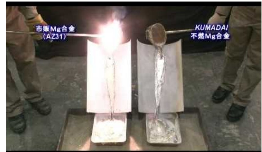
Fig. 2. Incombustibility of new Mg alloy when melted. Right side: new nonflammable alloy. Left side: Conventional commercially available Mg alloy.