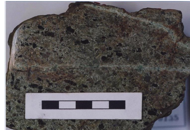
Figure 1. Mantle peridotite xenolith from Avacha volcano, the southern Kamchatka arc.

Mantle metasomatism and element transfer model by silicate melt(s) and/or fluid(s): It is expected that mantle peridotites, especially to sub-arc mantle ones, has been modified by silicate melts and fluids ( H_2O , CH_4 , and etc.) from downgoing oceanic plate. Based on some experimental research, hydrocarbon-rich and/or NaCl-rich aqueous fluid shows high solubility of incompatible elements (LILE and HFSE) and some compatible elements (e.g., PGE). We examine the degree of modification by such fluids with natural mantle peridotite samples (Fig. 2).