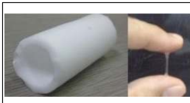
Figure 2 Biomimetic Bearing materials