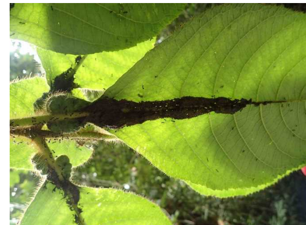
Figure 2. Callicarpa saccata , with leaf-base sacs inhabited by ants