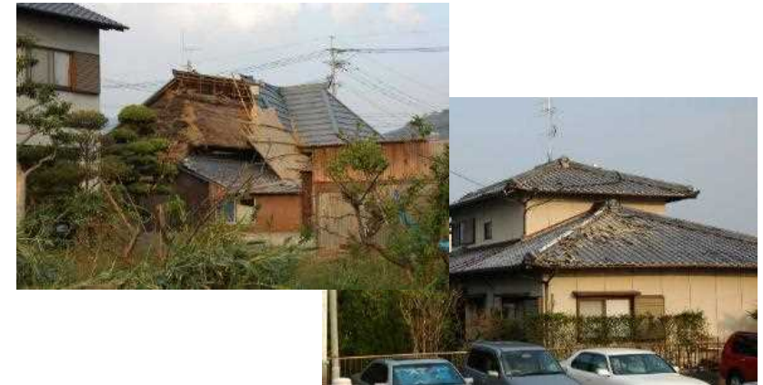
Figure 1 Structural damage due to Typhoon Tokage (0423)

Since variables which are hard to express with a numerical value like materials and shapes of roofs affect expansion of damage, we might be unable to predict strong wind damage accurately. We quantify those variables and include them in the factor analysis.