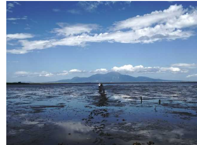
Figure 1 Shirakawa River Delta

Sand particles have many characteristics like sand grain size, roundness, standard deviation, skewness, color, mineral compositions and chemical elements. They are closely related to sediment transport or beach profile changes.