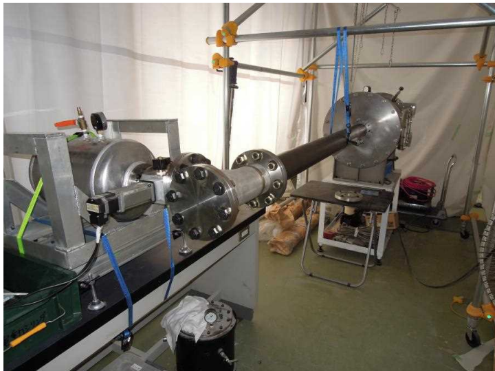
Figure 1 Photograph of air-gun