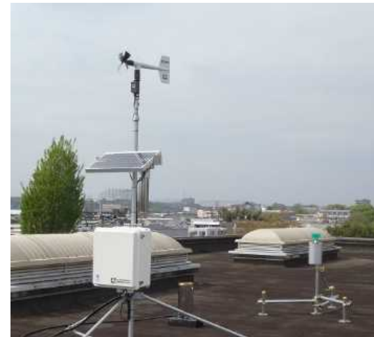
Figure 1 Automatic Weather station and rainfall sampling at Kumamoto University.

Origin and transport process of water vapor: Meteorological sounding and rainfall sampling for stable isotopes are conducting at the campus of Kumamoto University, which is cooperated with International Atomic Energy Agency/Global Network for Isotopes in Precipitation (Figure 1). Stable isotopes of sampling water are analyzed, and factors controlling their spatio-temporal variability are studying. Origin and transport process of water vapor are simulated by using Isotope-General Circulation Model (Figure 2).