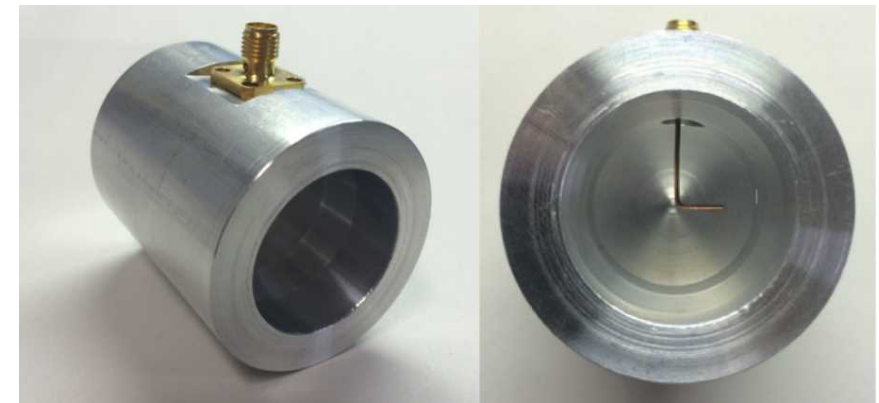
Figure 1 An Broadband circularly polarized antenna Radiating CP for wide range of azimuth angle.

Applied metamaterial technology for antennas: Metamaterial is an engineered periodic structure showing electrical characteristics that we can't find in the nature. Metamaterials can achieve the characteristics of magnetic wall, negative phase vector in the wave resulting in broadband antenna characteristics so that such antennas can be applied for broadband telecommunication, RADARs, radio astronomy and several sensors.