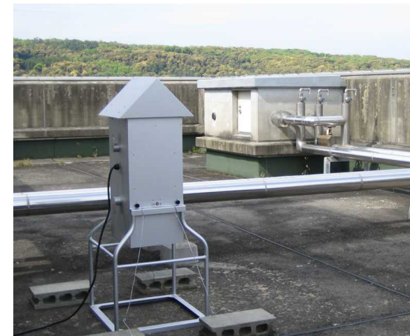
Figure 2 High-volume air sampler for chemical analysis.