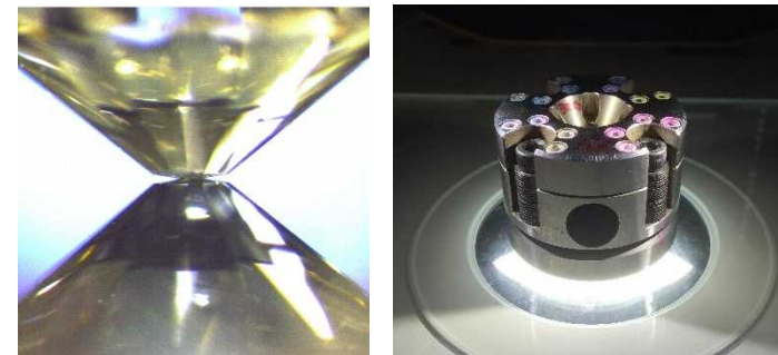
Figure 1. Diamond anvil cell. A material is squeezed and pressurized between two single crystal diamond anvils (left) in the cell (right).

Extreme high-pressure conditions exist in nature, as in planetary interiors. Earth's core is located under conditions of >135 GPa and >4000 K, where most of the core is molten. To understand its chemistry and dynamics, for example, we study the pressure evolution of P-wave velocity of liquid Fe alloys (Fig. 2) based on acoustic phonon measurements in the liquids, then compared with the seismic wave through the core.