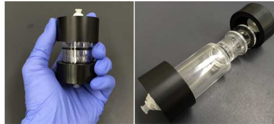
Figure 1 Fabricated portable cancer diagnosis device.

Creation of functional artificial tissues by gel-micromachining technique: The cell micropattern and artificial tissues were created by newly developed gel-micromachining technique. This technique is apply to regenerative medicine, medical transplantation using own cells, and drug discovery.